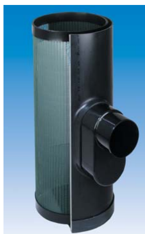
(Doorsnede) PVC Onderbak met korffilter