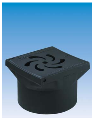
GY Bovenstuk trottoirkolk

De DuBoRain straatkolk wordt toegepast bij regenwater infiltratiesystemen. Het bovenstuk van de kolk is voorzien van een GY-deksel waarop een waaiermotief is aangegeven. Hierdoor is snel en eenvoudig te zien dat de kolken zijn aangesloten op een infiltratie systeem. In de onderbak wordt een korffilter geplaatst, welke vervuiling met straatvuil in de IT-buizen of boxen voorkomt. Tevens dient de onderbak als zandvang.